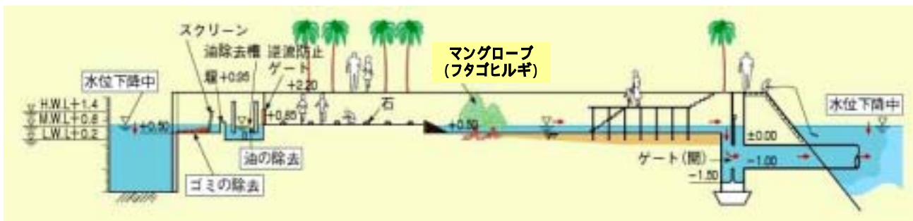
図-3 ジャカルタ漁港内海水交換システム標準断面図

密生した支柱根・筍根周辺に発生する動植物プランクトンや支柱根によるナーサリー効果により新たなエビ・カニ等の生態系が回復する。