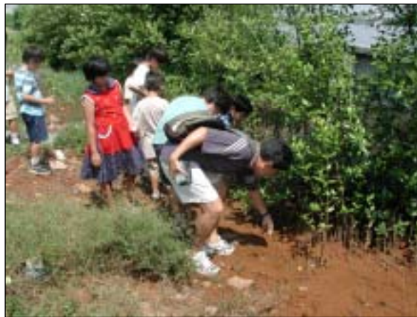
写真-7 ジャカルタ日本人小学校の授業風景