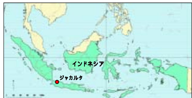
図-1 ジャカルタ位置図

ジャカルタ漁港(写真-1)は、1973年に海外技術協力事業団(現 JICA)のフィービリティ調査の後、海外経済協力基金(現 JBIC)の円借款など日本のODAによる支援を受けて建設されたインドネシア最大の漁港であり、1984年に供用開始された。しかし、ジャカルタ漁港の建設サイトは、もともと遠浅かつ脆弱な地盤という厳しい条件下にあったことから、埋め立て後20年を経た1990年代後半には、地盤沈下等による影響が現れ、早急なりハビリ対策の必要に迫られていた。