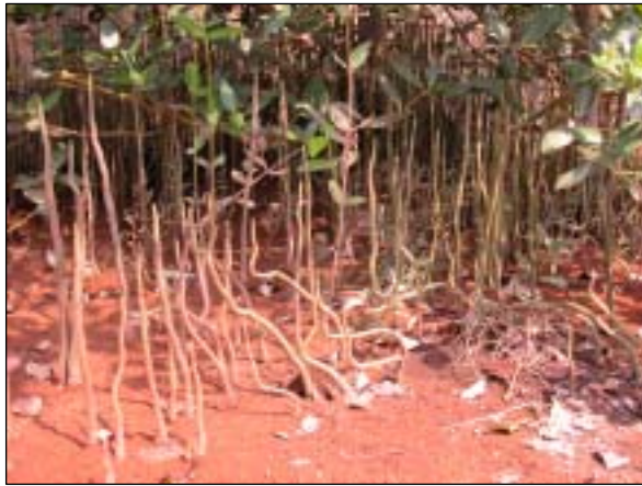
写真-6 密生するヒルギダマシの筍根