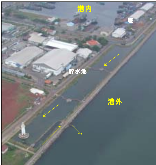
写真-8 港内海水システム全景写真

なお、マングローブによる水質浄化機能については、マングローブの密生した支柱根・筍根やその周辺に発生する新たな生物により海水に含まれる有機物の分解・吸収に役立つことが期待されているが、現在漁港内における工場廃水の一部が混入していることから、これら防止等施設の維持管理を確かにした上で、今後定量効果を計測する必要がある。