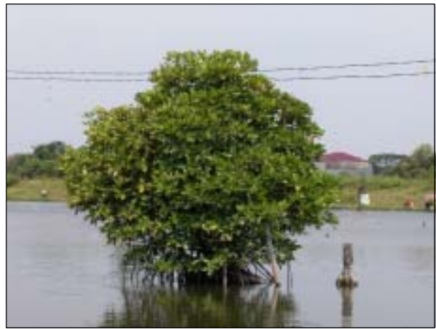
写真-2 フタゴヒルギ (Bakau)

また，ジャカルタ漁港周辺のマングローブ踏査の結果から，常時水没する環境に適したフタゴヒルギ（写真-2，学名 Rhizophora apiculata ，現地名 Bakau）と数時間水没する環境に適したヒルギダマシ（写真-3，学名 Avicennia marina ，現地名 Api Api）が当地においては勢力種であるとともに，今回の護岸施設及び海水交換システムへの適用種として，前者は深く根（支柱根）を張ることから地盤の強化に適する一方，後者は広く浅く根（筒根）を張ることから表土流出防止に適するという特性が明らかになった。