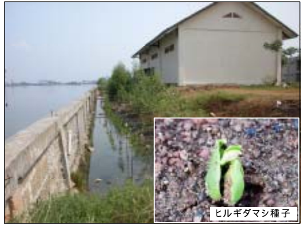
写真-4 マングローブ植栽直後の西護岸(2000年12月)

マングローブはもともと自生力が強く、また、成長力も早い植物である。特に、ヒルギダマシは2年後には、自ら種子を落下させ自然繁殖を繰り返し、約3年後の2003年には5mに成長し1kmのほぼ全体にわたりマングローブが生い茂る自然の護岸となった(写真-5)。