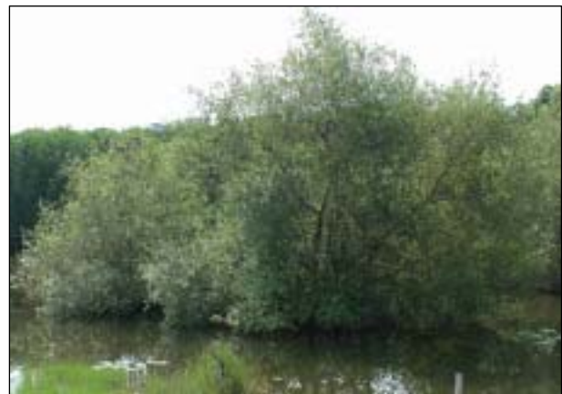
写真-3 ヒルギダマシ (Api Api)

ジャカルタ漁港西護岸の改良及び港内水質交換システムへのマングローブの適用に当たり，現地に多種類存在するマングローブの特性を把握した上で，各施設に求められる機能への適用性から効果的なマングローブの選定を行う必要があった。このため，当時 JICA によるバリ島でのマングローブプロジェクトの調査結果，文献調査並びにジャカルタ周辺におけるマングローブ林踏査等を通じ，個々のマングローブの特性と構造物等への適用性を調査した。