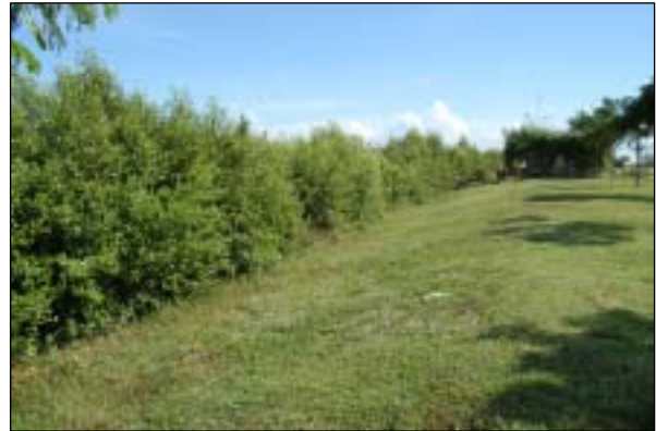
写真-5 マングローブ成長後の西護岸(2003年12月)