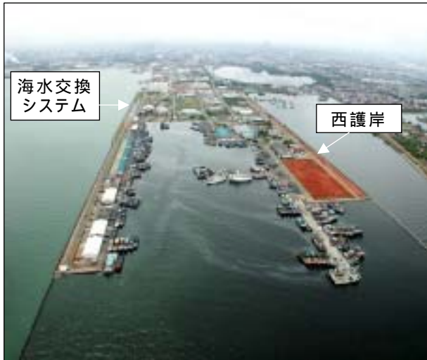
写真-1 ジャカルタ漁港全体写真

このため，整備後約 20 年が経過したジャカルタ漁港の西護岸の沈下対策に加え，新たな課題としてのジャカルタ漁港の水域環境改善対策を講じるにあたって，現地に豊富に存在するマングローブを活用した簡易かつ経済的な手法による自然共生型の護岸施設及び港内水質交換システムの導入を試み，その効果を把握することとした。