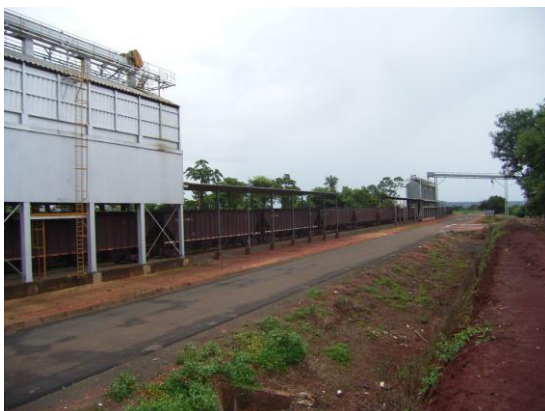
マラニョン州インペラトリス市近郊にあるポルト・フランコ地区の殺物貯蔵・積込施設。(2012年2月、本郷豊撮影)