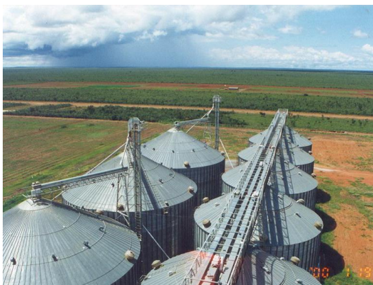
マラニョン州ジェライス・デ・バルサスのプロデセル事業地の穀物サイロ。 (2000年1月、本郷豊撮影)