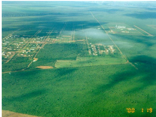
マラニョン州ジェライス・デ・バルサスのプロデセル事業地に造成された市街地区を上空から。最寄りのバルサスの町まで約200kmの距離があり、入植者は一カ所に集中して居住した。 (2000年1月)