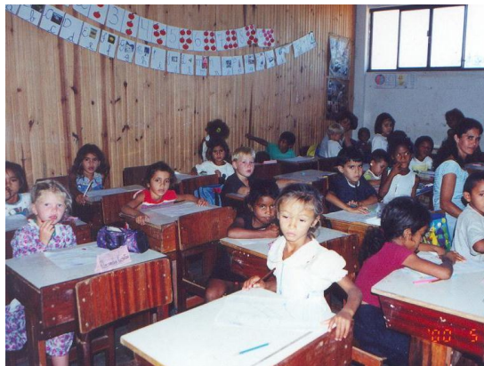
マラニョン州ジェライス・デ・バルサスのプロデセル事業地内に建設された小学校。これにより地元の多くの児童が学ぶ機会を得た。 (2000年1月、本郷豊撮影)