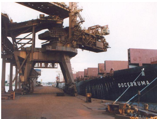
マラニョン州サン・ルイスのマデイラ港。(2000年1月、本郷豊撮影)