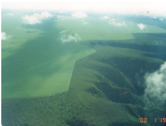
マラニョン州ジェライス・デ・バルサスのプロデセル事業地を上空から。事業地は左奥の高台平地(シャバドン)に造成された。(2000年1月)