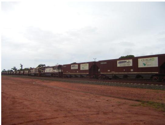
マラニョン州インペラトリス市近郊にあるポルト・フランコ地区での南北鉄道の穀物専用貨車。(2012年2月、本郷豊撮影)