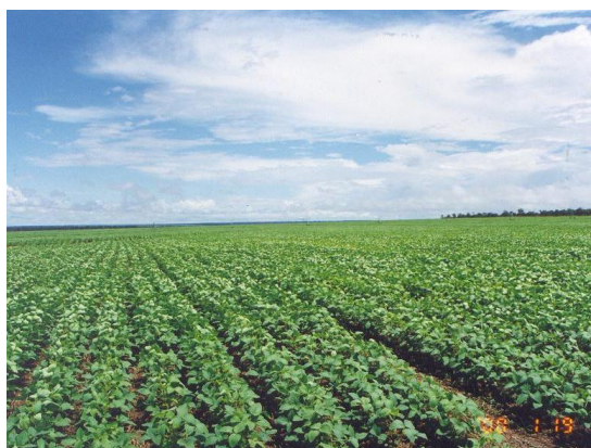
マラニョン州ジェライス・デ・バルサスのプロデセル事業地の大豆畑。 (2000年1月)