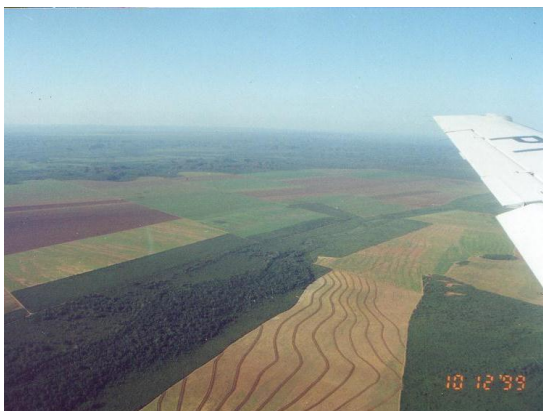
マラニョン州ジェライス・デ・バルサスのプロデセル事業地を上空から。川沿いの森林は溪畔林として保護されており、また、等高線栽培が土壌侵食を防止している。(1999年12月)