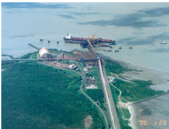
マラニョン州サン・ルイスのマデイラ港を上空から。 (2000年1月)