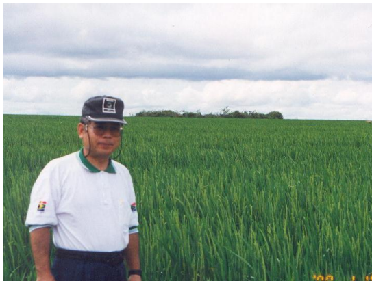
マラニョン州ジェライス・デ・バルサスのプロデセル事業地の陸稲栽培。 (2000年1月)