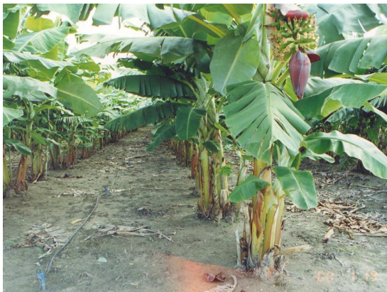
マラニョン州ジェライス・デ・バルサスのプロデセル事業地のバナナ畑。灌漑用の水資源を節約するため、左側にあるホースによる点滴灌漑が実施されている。(2000年1月)