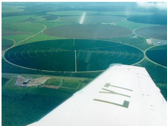
バイア州ルイス・エドゥアルド・マガリャエス市を上空から望む。センター・ピボット方式による灌漑によって開花時期と収穫時期をコントロールする。(2000年1月、本郷豊撮影)