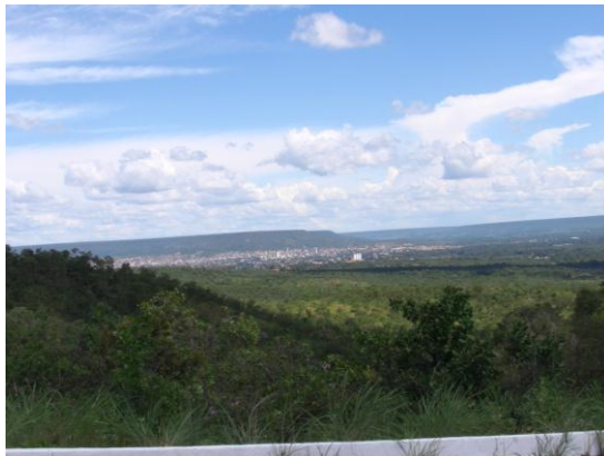
バيا州バレイラス市の街並みを遠望する。 (2011年1月、本郷豊撮影)