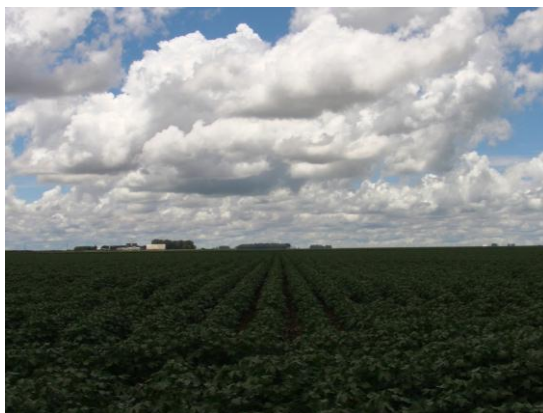
バيا州バレイラス市近郊の日系農場の綿花畑。GPS搭載トラクターによる播種作業によって、畝が数百メートルにわたって直線を保つ「精密農業」が行われている。(2011年1月)