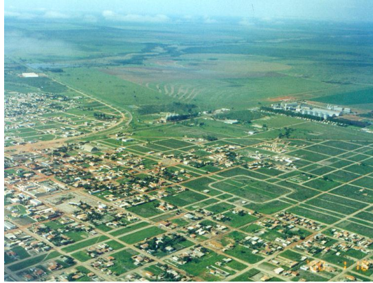
パイア州ルイス・エドゥアルド・マガリャエス市を上空から望む。右手には搾油工場、その奥には大豆畑が広がる。 (2000年1月、本郷豊撮影)