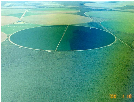
パイア州ルイス・エドゥアルド・マガリャエス市を上空から望む。円形に見えるのはセンター・ピボット方式灌漑によるコーヒー栽培地。 (2000年1月)