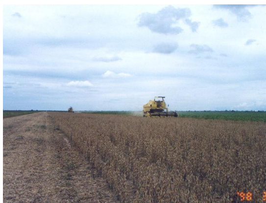
バイア州オーロ・ベルデ事業地での大豆収穫風景。 (1998年3月、本郷豊撮影)